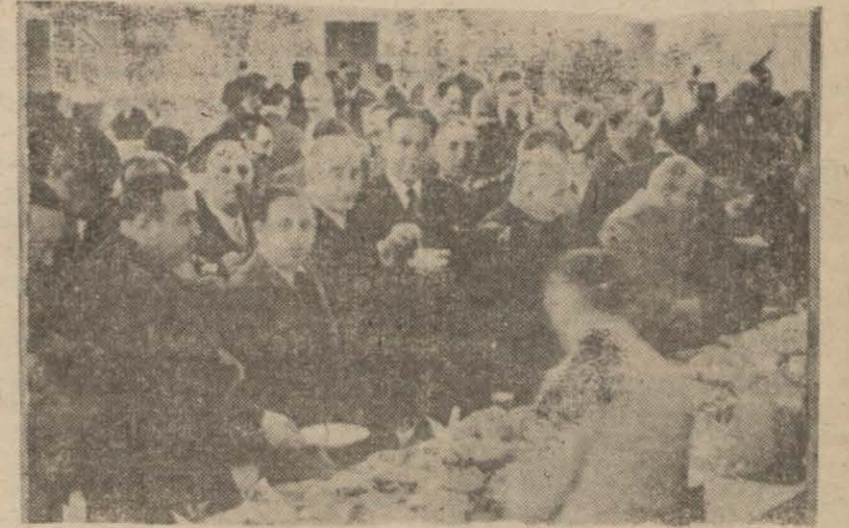
Partinin delegeler şerefine verdiği zıvafetten bir intiba

Hatiblerin mühim meselelere temas eden sözlerinden sonra intihab yapıldı